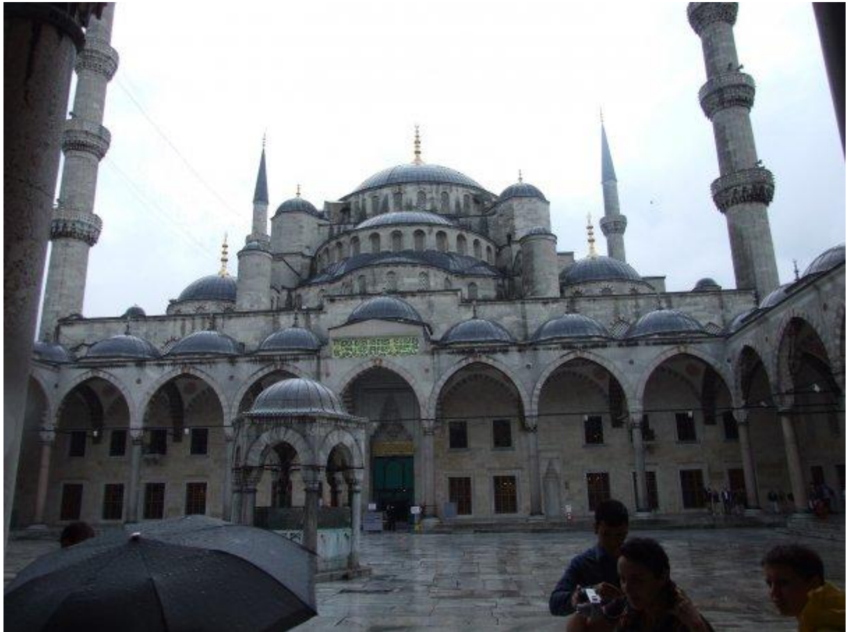
5. Pohľad z nádvorja modrej mešity