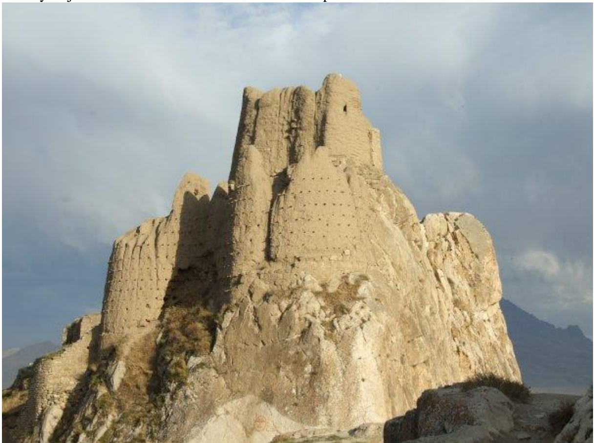
14. Van castle