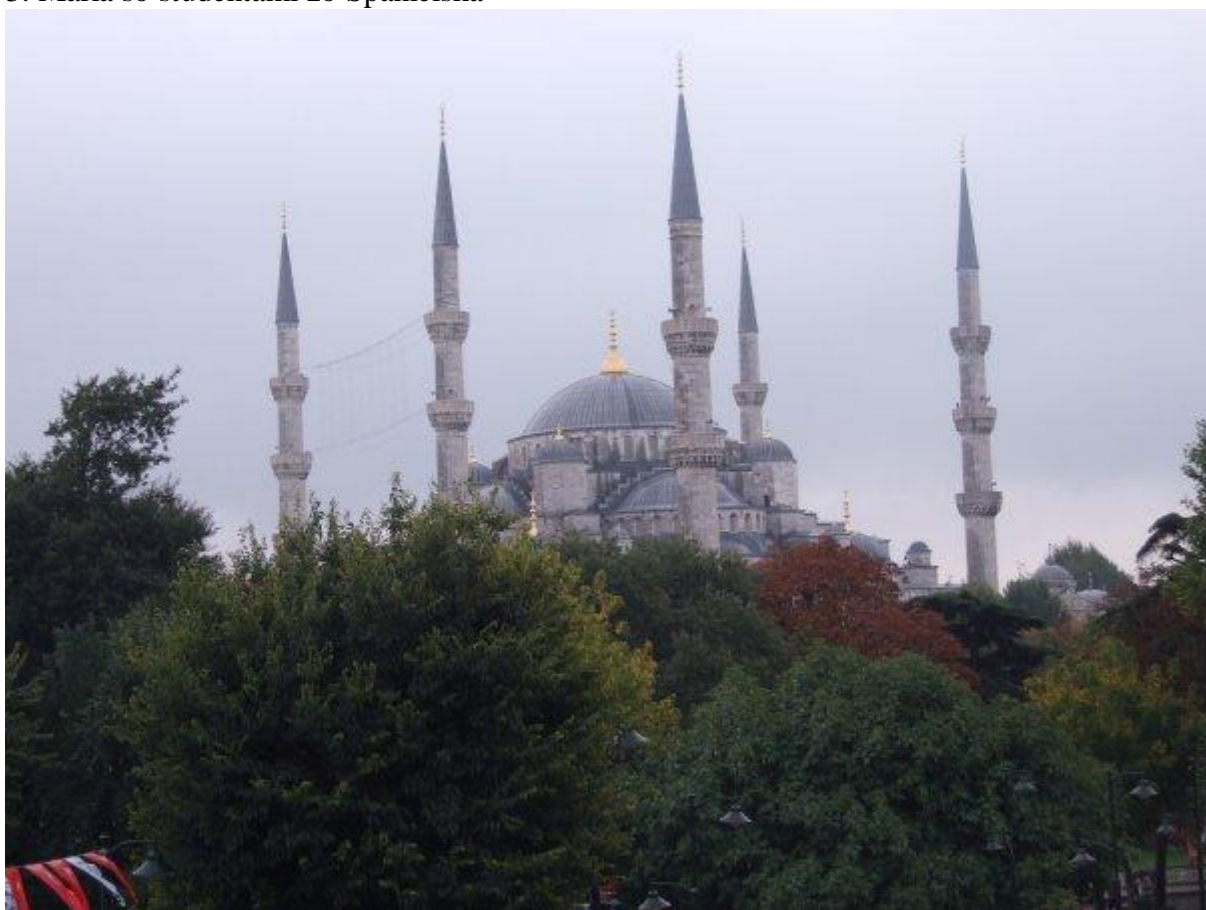
4. Najznámejšia mešita na svete – Modrá mešita