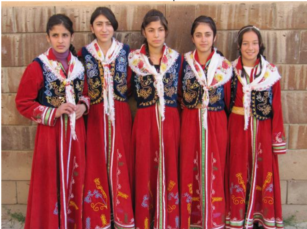
19. Mladé Turkyne z folklórneho súboru