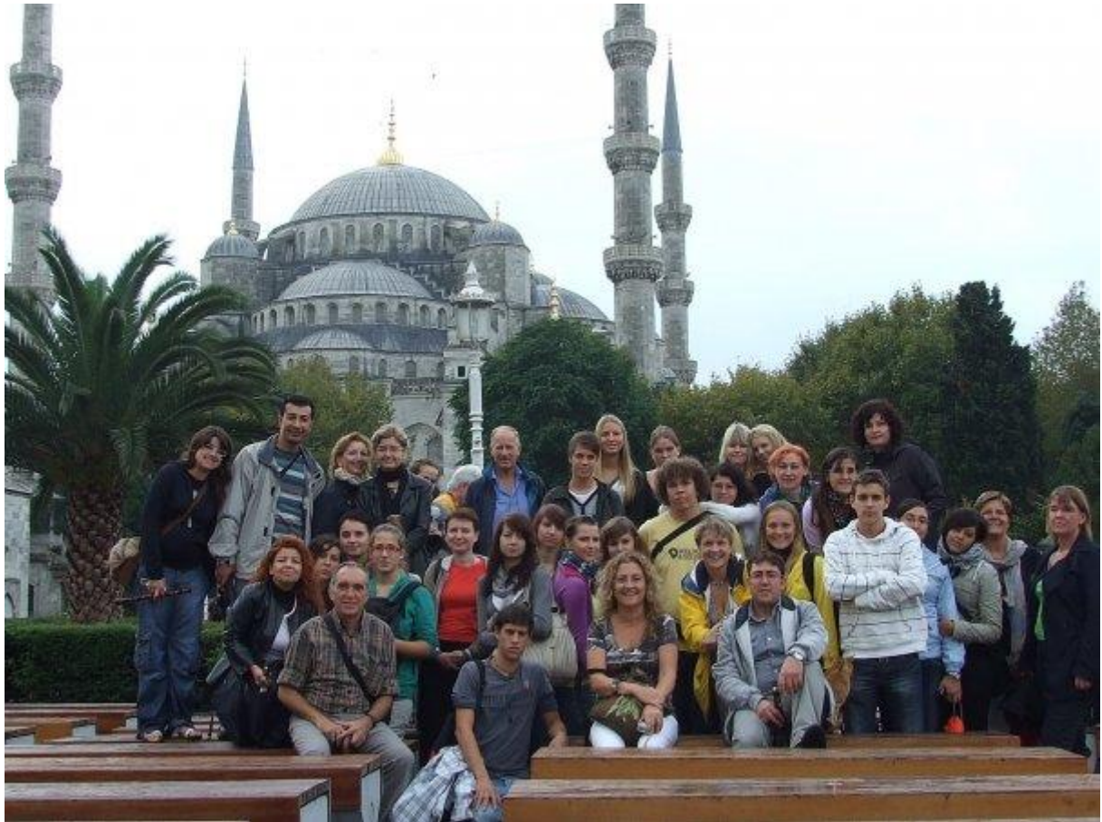
9. Celá naša skupna pohromadeJ