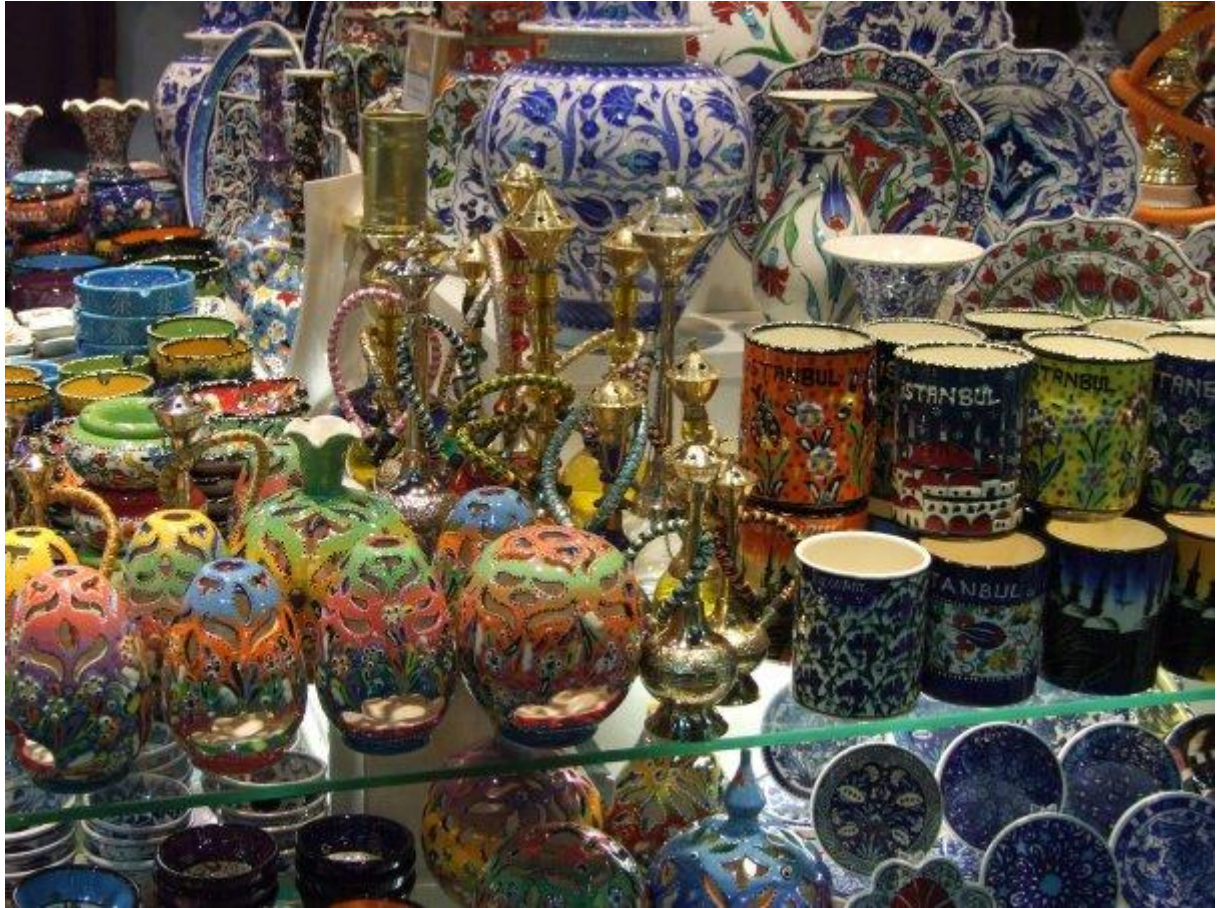
1. Pohľad na stánok v istanbulskom Grand bazari