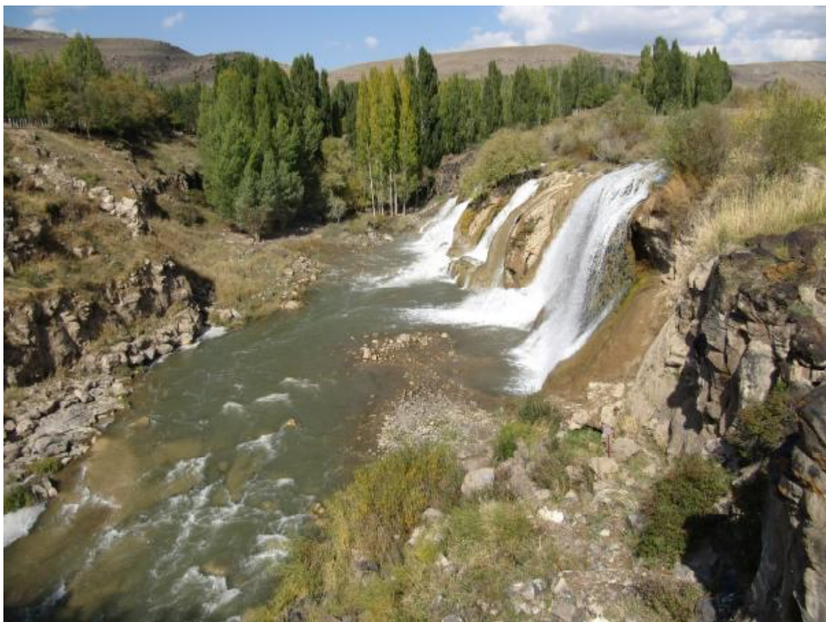
20. Nádherne vodopády východne od mesta Van