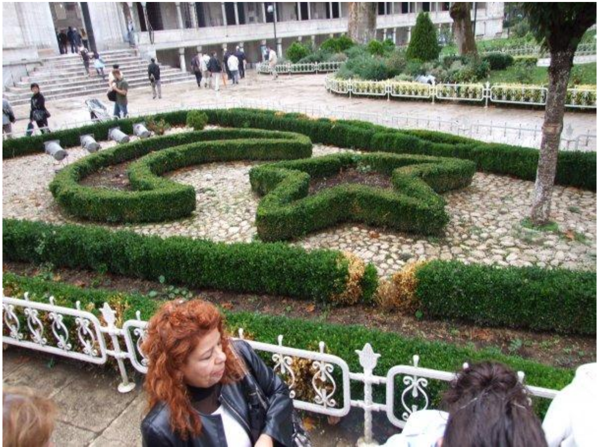
7. Turecka vlajka v podobe živého plota v Istanbule