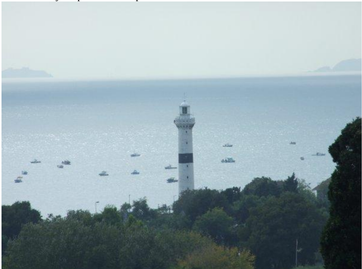
8. Vyhľad zo sultánového balkóna v paláci v Istanbule na Bospor