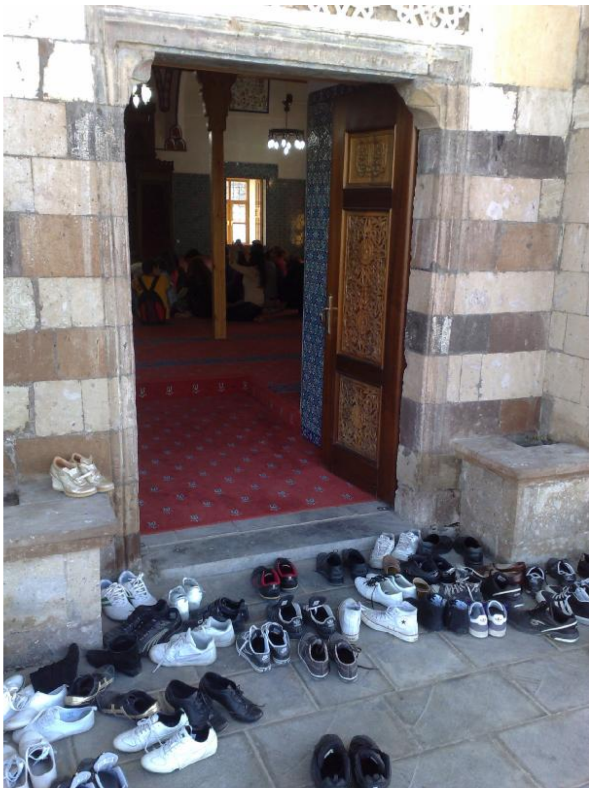
12. Samozrejme pred vstupom sme sa museli vyzuť