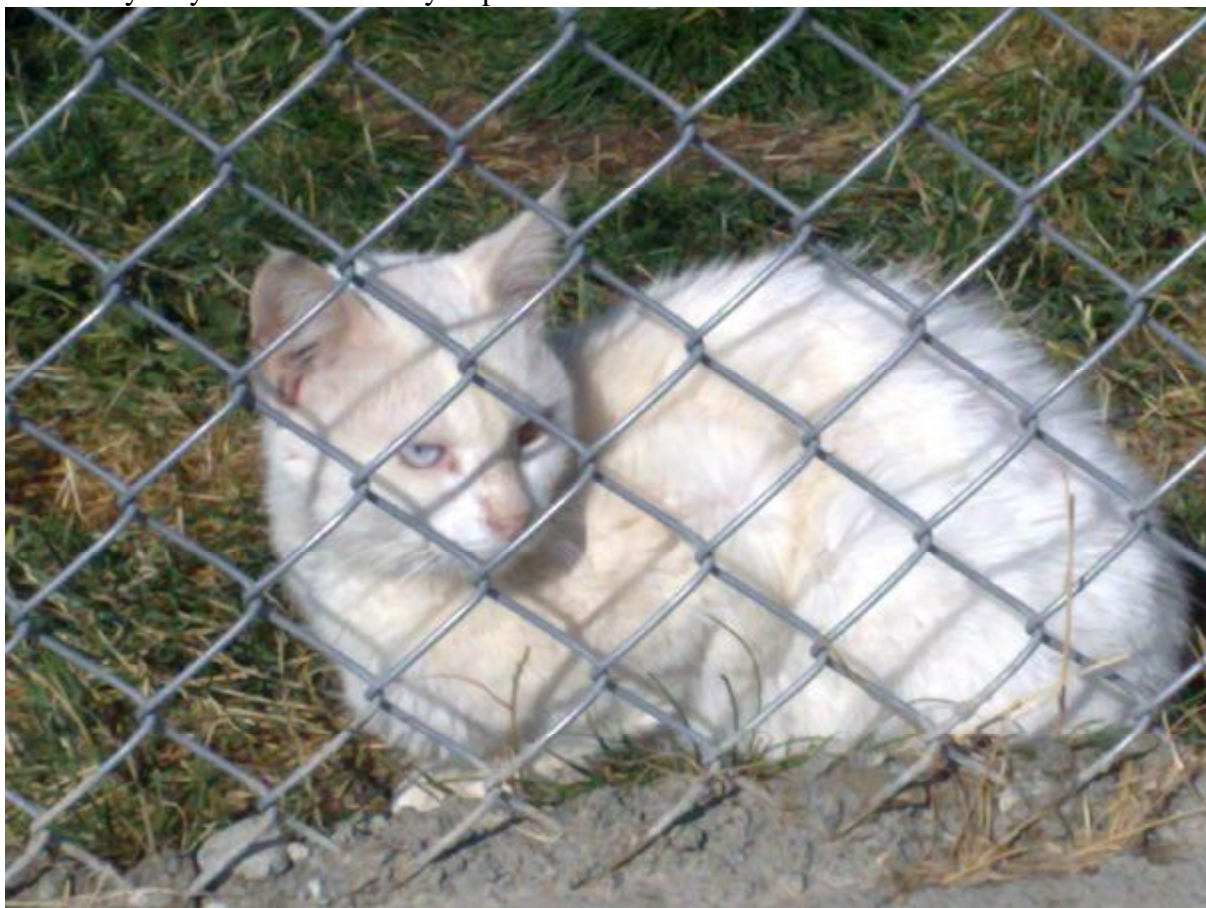
16. Vzácná vanská mačka, ktorá je symbolom mesta, pretože má jedno oko modré a druhé žlté