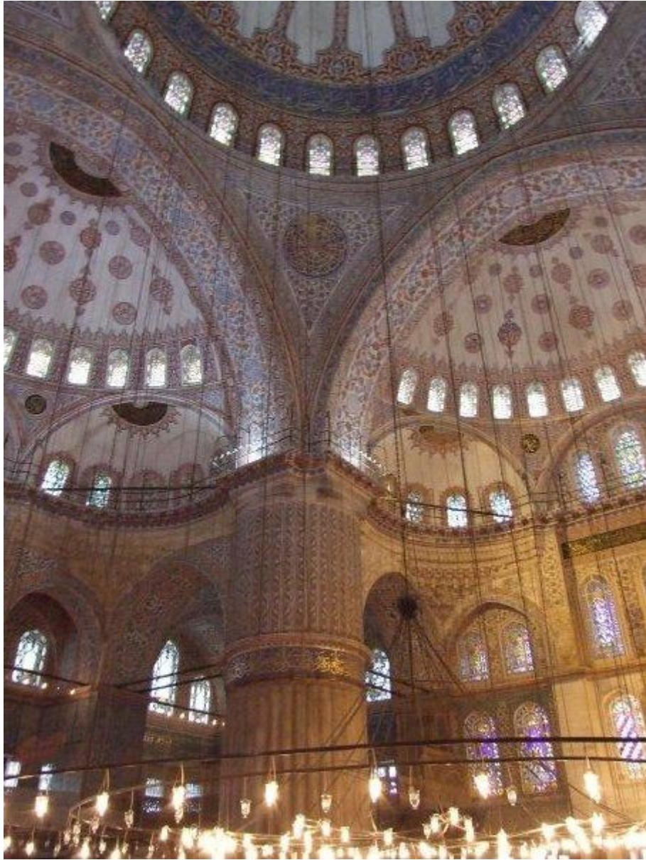
6. Priestory modrej mešity