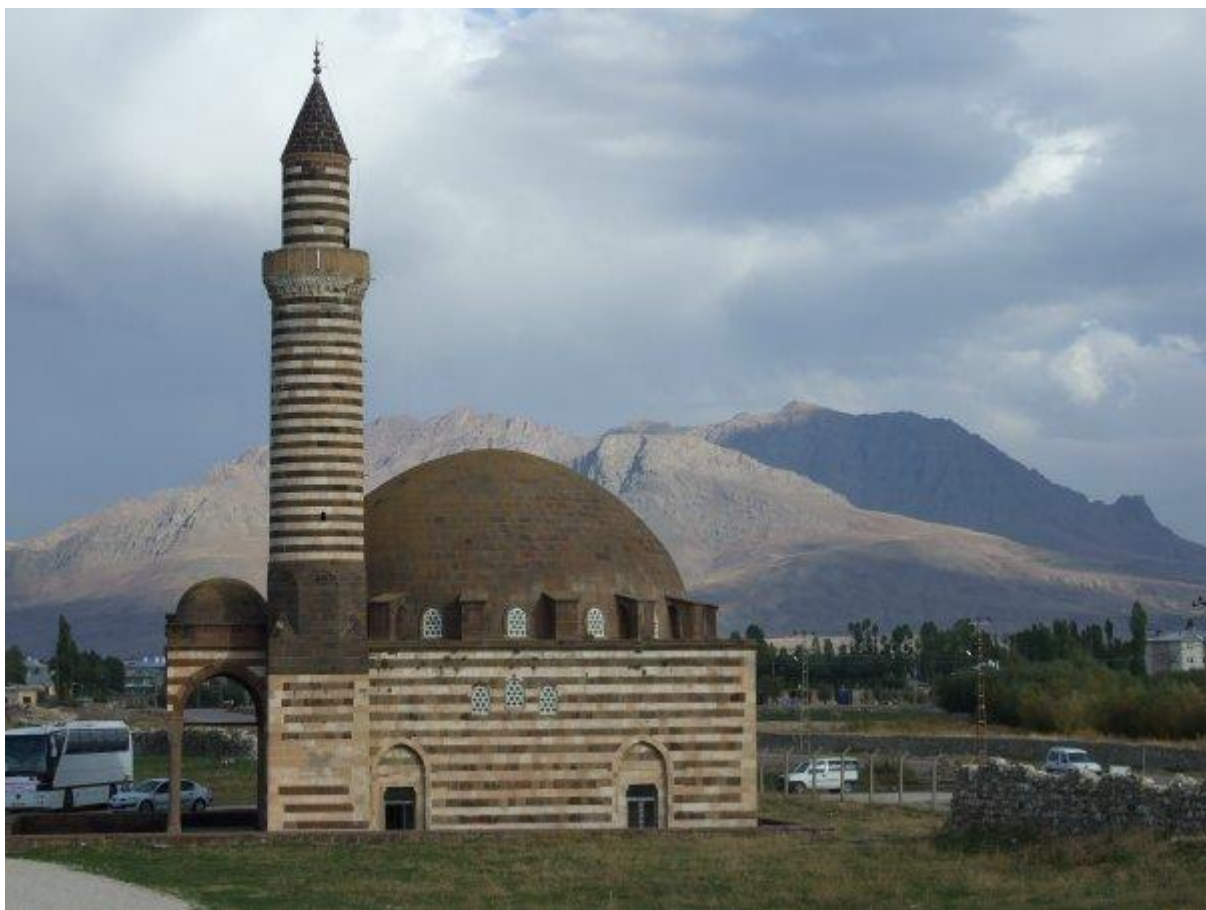
11. Presunuli sme sa na východ krajiny do mesta Van a navštívili jednu z najstarších mešit v krajine