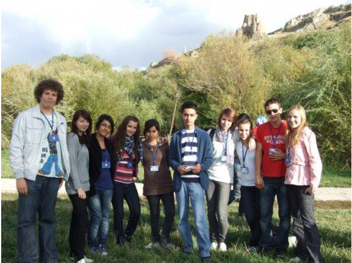
13. My traja so študentami a študentkami z Pol'ska pod Van castle