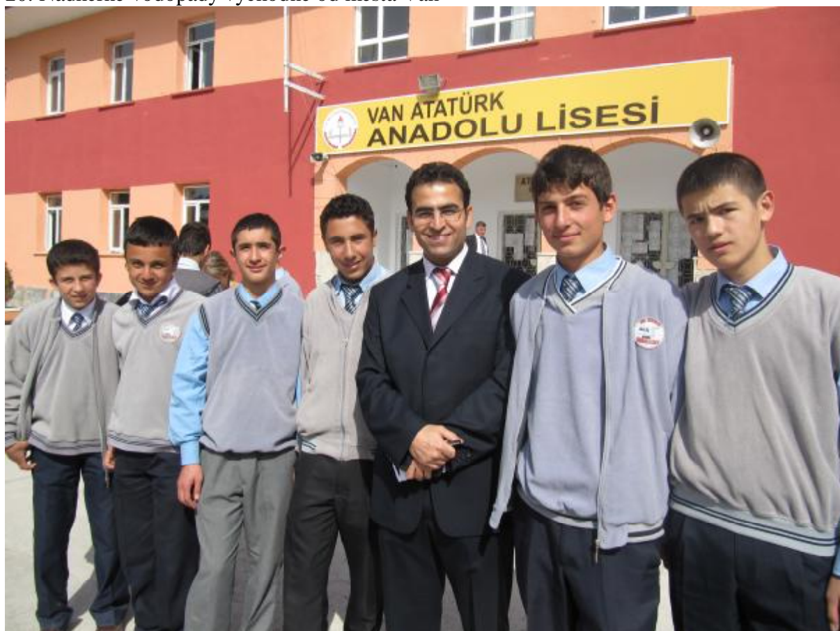
21. Študenti tureckej strednej školy v školských uniformách so zástupcom školy