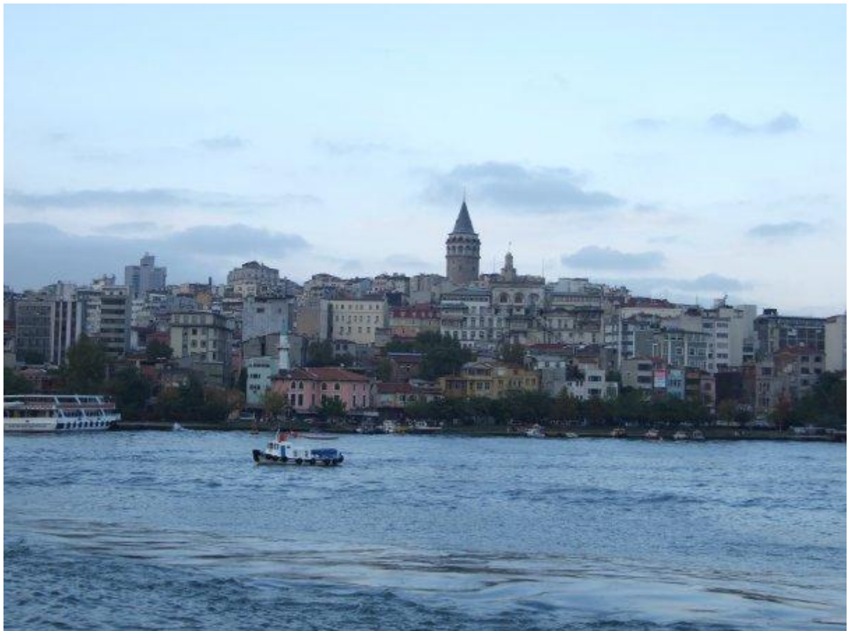
2. Istanbul pri plavbe cez Bospor