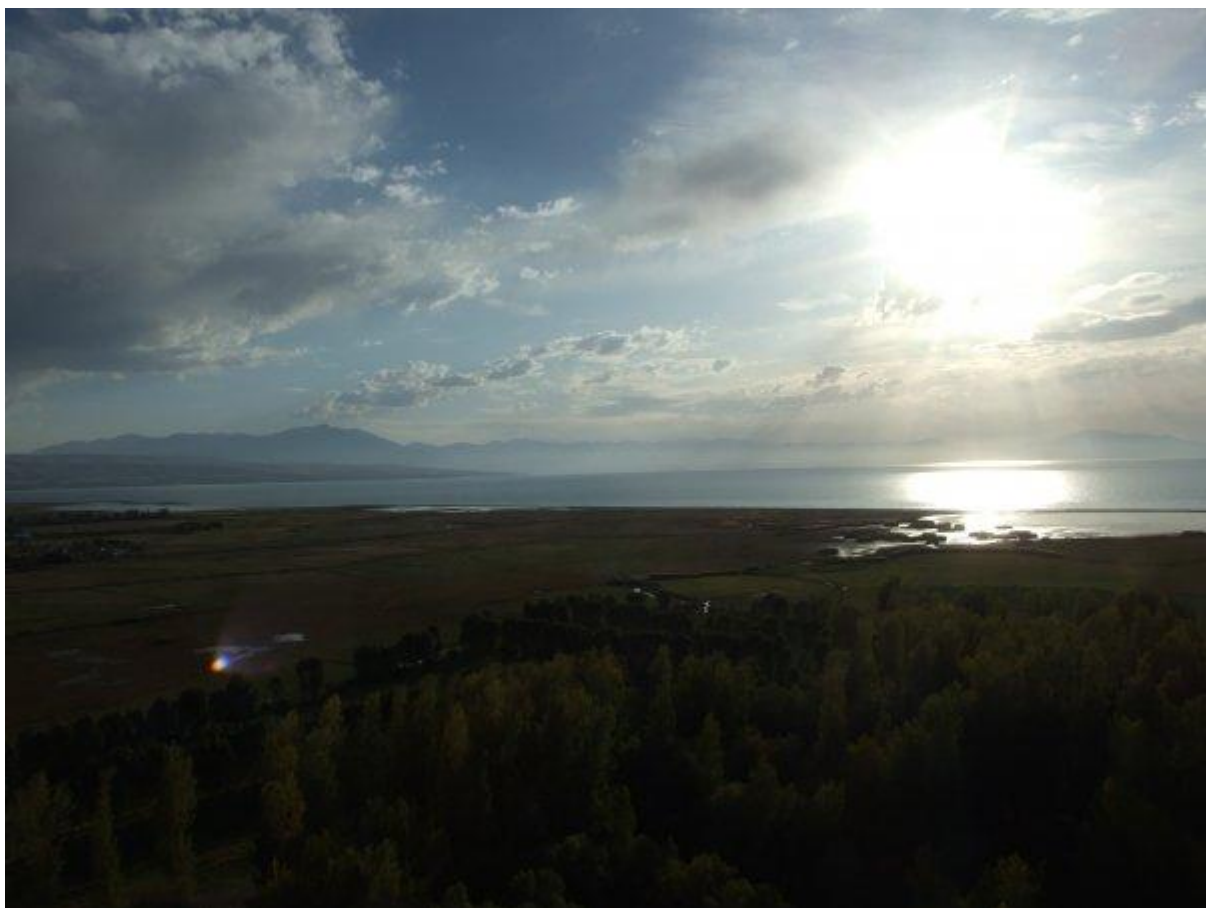
15. A takýto výhľad sa nam naskytl po zdolaní skál v okolí hradu